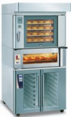
EUROMAT B 4 IS 600 in EBO 1-64 DIGITAL Prostor za pečenje GS 20 Napa Mere pekača: 600 x 400 mm