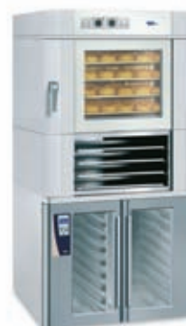
EUROMAT B 4 M Prostor za pečenje GS 20 Etažne police ETF 4 Mere pekača: 600 x 400 mm

Klasična pečica podjetja WIESHEU. Najsodobnejša tehnika v privlačni obliki. Z v prihodnost usmerjeno tehnologijo pečenja in sodobno obliko so pečice na vroči zrak Euromat popolna rešitev za vaše individualne zahteve. V kombinaciji s prostorom za pečenje, etažno pečico, etažnimi prostori in inteligentno napo imate na voljo postajo za pečenje, ki ustreza najvišjim zahtevam in jo je mogoče harmonično vključiti v vaše prodajne prostore. Ne vsaka podrobnost skupaj, ampak vsota vseh delov je razlog, da je najbolj vroča novost podjetja WIESHEU tako zaželena. Sedaj z inteligentno krmilno enoto IS 600 in ročno krmilno enoto za še več udobja, varnosti in ekonomičnosti.