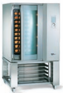
DIBAS 10 Podstavek UG 10 Mere pekača: 600 x 400 mm