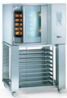
DIBAS 5 Podstavek UG 20 Mere pekača: 600 x 400 mm