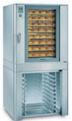
EUROMAT B 8 IS 600 Podstavek UG 20 Mere pekača: 600 x 400 mm