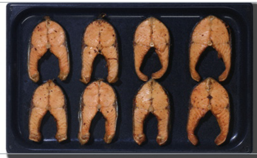
vstavitev počez 1/1GN